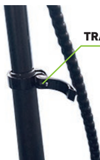
TRAVA AJUSTE DE ALTURA DO GUIDÃO

Passo 5: Abra o fecho, aperte os outros 50% do parafuso com a chave Allen M6.